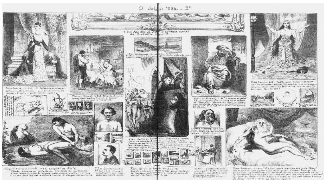
Figura 4: Salão caricatural da exposição de Belas Artes de 1884- 3ª parte. Revista Ilustrada , v. IX, n o 391, p.4-5.

Além da menção a quadros dos dois irmãos, o segundo salão caricatural de Ângelo Agostini, impresso no ano citado, expôs tela de Antônio Firmino Monteiro (quadro n o 44), de Augusto Burgaim (quadro n o 52), de Belmiro B. de Almeida (quadro n o 74), de G. Frate (quadros n os 157 e 158), de Leopoldino J. de Faria (quadro n o 214), de Pedro Peres (quadro n o 262 e retrato n o 267), de Rodolfo Amoedo (quadro n o 272), entre outros.