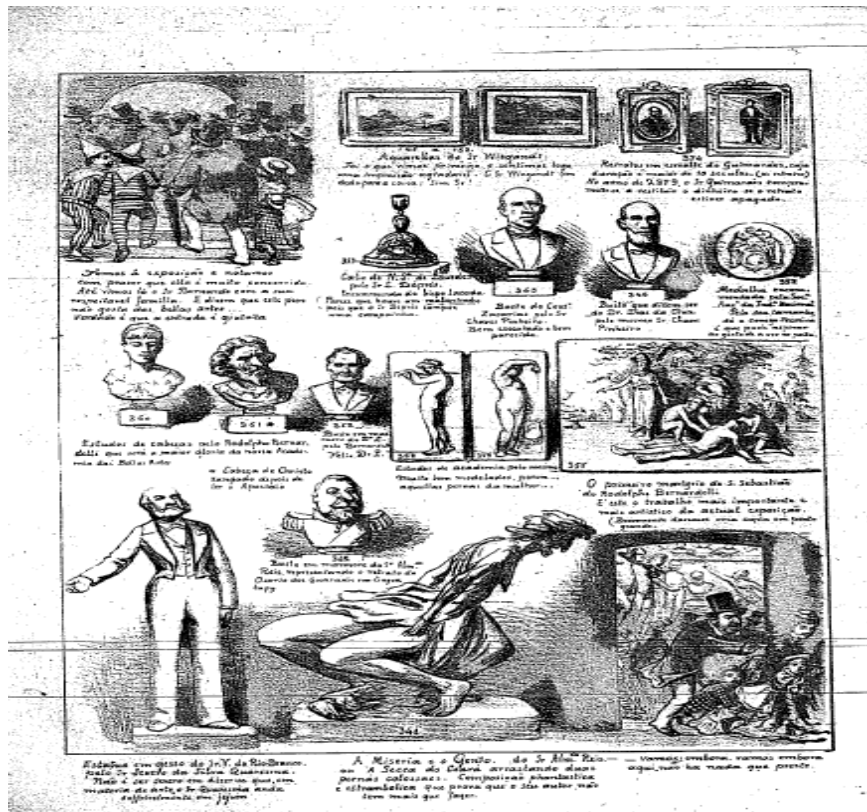
Figura 2: Salão caricatural da exposição de Belas Artes de 1879 - 1ª parte. Revista Ilustrada , v. IV, nº 155, p. 8.