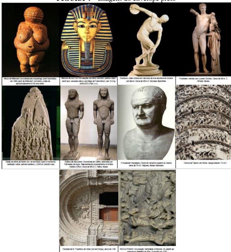
FIGURA 4 – Imagens do envelope preto 4