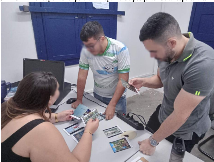
FIGURA 3 – Trio responsável pelo envelope verde pesquisando a respeito das imagens