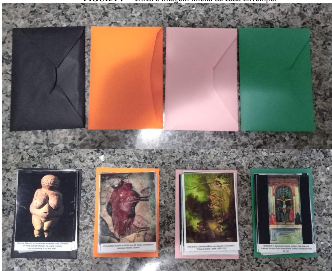
FIGURA 1 3 – cores e imagem inicial de cada envelope: