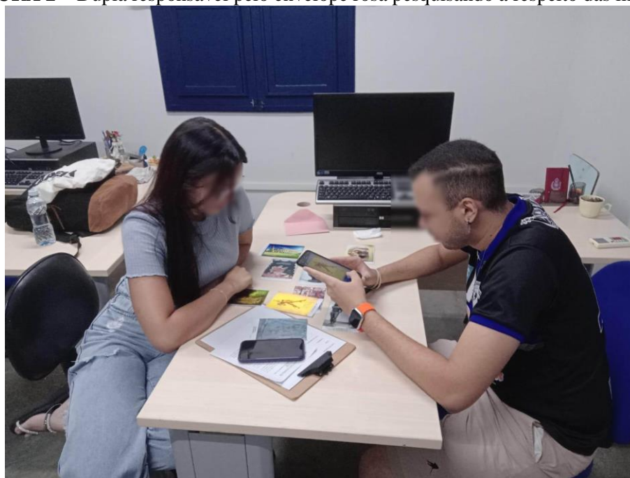
FIGURA 2 – Dupla responsável pelo envelope rosa pesquisando a respeito das imagens

dos textos lidos e aulas expositivas, tentar identificar quais duas imagens poderiam ser trocadas para a construção da narrativa. Considerando o número de alunas e alunos, optou-se por utilizar apenas três envelopes, ficando o envelope laranja sob responsabilidade do docente. A seguir, as imagens 1 e 2 mostram dois grupos no processo de pesquisa, tentando relacionar as imagens e, a partir da temática, selecionar as duas que não se encaixariam na narrativa expositiva.