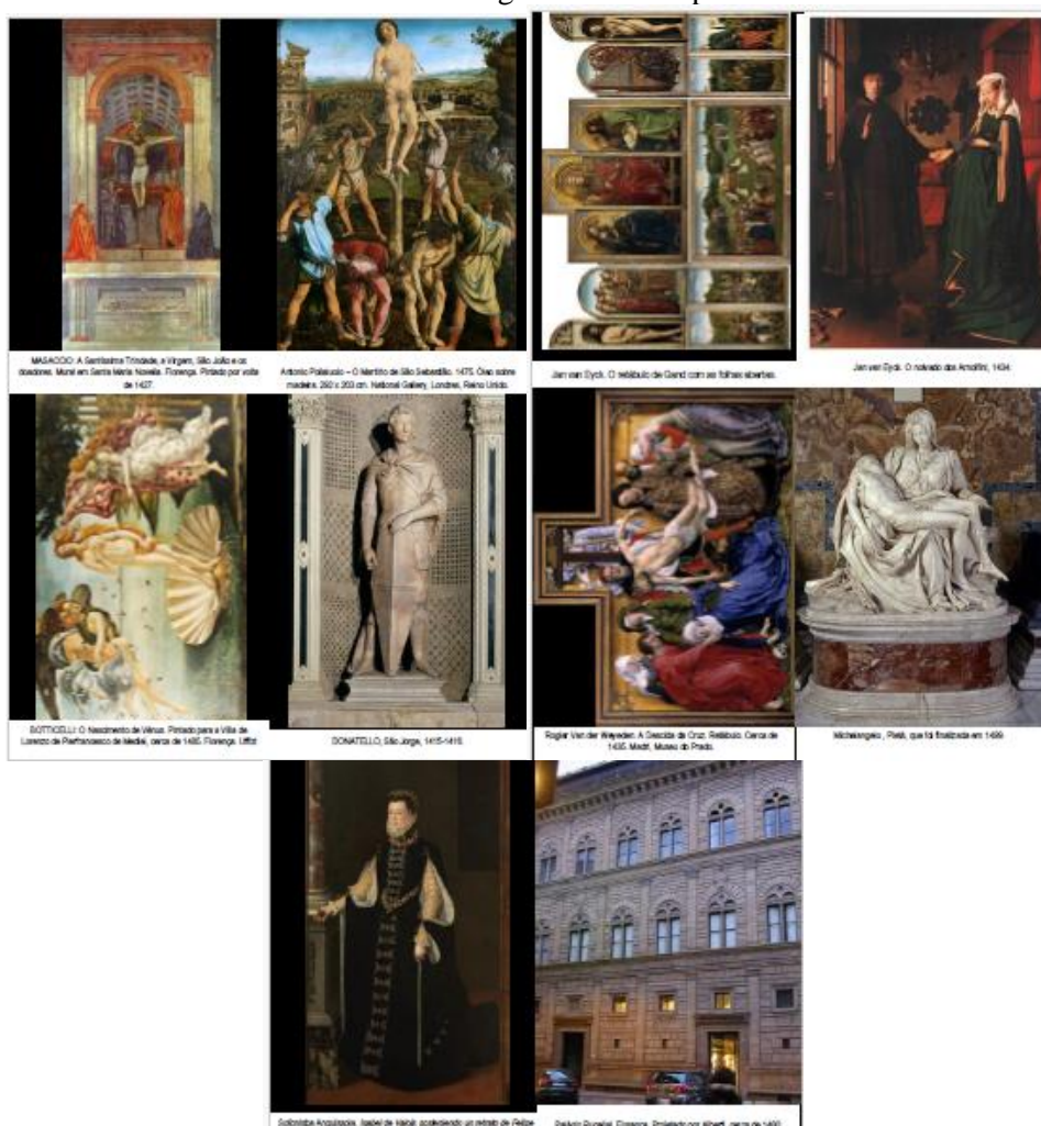
FIGURA 6 – Imagens do envelope verde