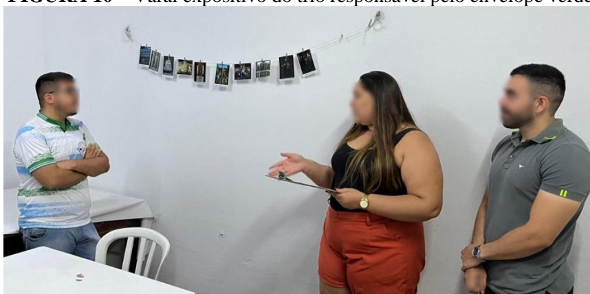
FIGURA 10 – Varal expositivo do trio responsável pelo envelope verde