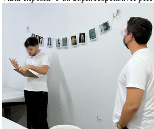
FIGURA 8 – Varal expositivo da dupla responsável pelo envelope preto

A quinta etapa encerra a atividade com a construção do varal expositivo, com a apresentação do texto de abertura da exposição e com a mediação para o grupo de “turistas culturais” (os colegas) e para o marchand (professor).