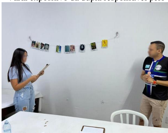
FIGURA 9 – Varal expositivo da dupla responsável pelo envelope rosa