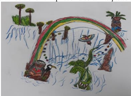
FIGURA 4 – Cartaz do aluno P. inspirado na obra: " Naipiowska z Tarobanskyj "