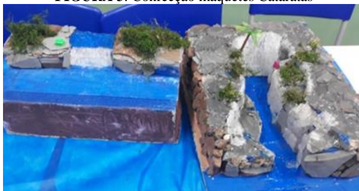
FIGURA 3: Confecção maquetes Cataratas

Outra prática realizada abordou a formação geológica das Cataratas do Iguazu. Foi proposta a construção de uma maquete demonstrando o tipo de vulcão que a originou, a localização geográfica há 1,5 milhões de anos, a fim de explicar como se deu a sua localização inicial. Também se construiu outra maquete demonstrando o local de origem e seu ritmo de erosão regressiva, com cerca de 2 cm por ano. As características do Cânion, dimensões, volume de água, medidas do rio antes e depois das cachoeiras também foram abordadas. Ainda, outra maquete foi estruturada a fim de demonstrar atualmente as quedas, com a adição de uma palmeira e uma rocha rosa fazendo alusão aos povos originários caingangues Tarobá e Naipi. Na confecção destas maquetes foi usada espuma oriunda da caixa de um ar-condicionado e o basalto foi representado por lascas de ardósia.