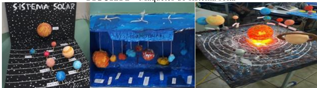
FIGURA 2 – Maquetes do sistema solar

Numa segunda prática realizada, foi proposta uma apresentação sobre nebulosas, buracos negros, estrela de nêutrons, formação e “morte” de uma estrela, representados por imagens explicitando a formação do sistema solar, sua atual estrutura e subdivisões. O docente dividiu a sala em grupos e solicitou aos alunos que produzissem maquetes do sistema solar. A metodologia da sala de aula invertida foi aplicada especificamente para um dos alunos que necessita de metodologias diversificadas. Assim, o docente solicitou que esse estudante trouxesse curiosidades sobre o sistema solar, “algo que apenas ele poderia explicar”. Ele trouxe a explicação sobre buracos negros, brancos e os de minhocas.