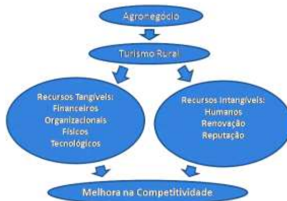
Figura 1: Requisitos chaves para obtenção de melhora da competitividade Fonte: Elaboração própria (2009).

Parece claro, portanto, que existem possibilidades de implementação de estratégias de diversificação em propriedades rurais, o que se viabiliza, principalmente, pelo acesso os recursos mencionados anteriormente, os quais são imprescindíveis para o sucesso da estratégia.