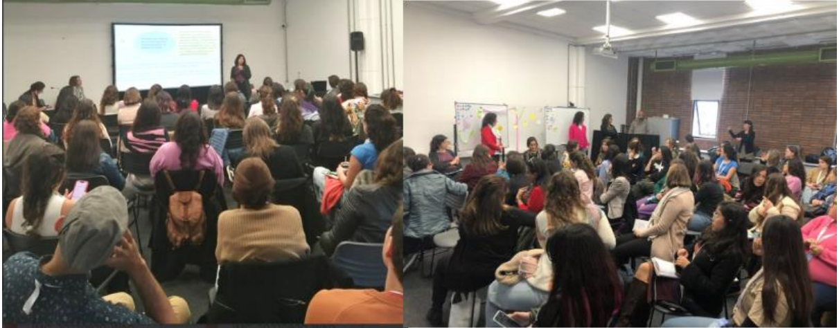
FIGURA 2 - Imágenes del encuentro +Mujeres + Ciencia + en el 15° Encuentro Bienal de la SETAC América Latina realizada del 17 al 20 septiembre del 2023 en la ciudad de Montevideo (Uruguay).