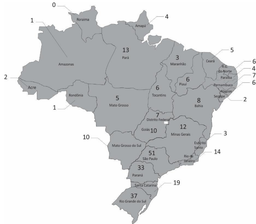
MAPA 01 - Distribuição dos grupos de pesquisa relacionados às políticas educacionais por unidade federativa do Brasil (2020)