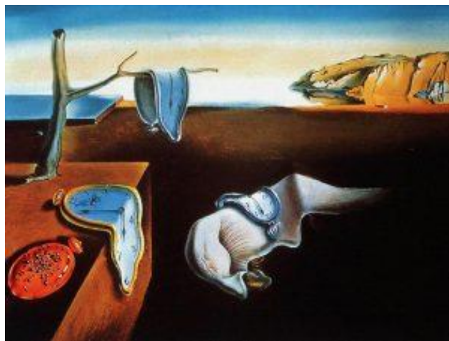
Figura 5 – A persistência da Memória- Salvador Dalí. 1931. Óleo sobre tela. 24 x 33 cm.

As Figuras 5 e 6 exibem o estilo de cada pintor, através delas percebemos o estilo do cubismo de Picasso nas formas geométricas, e do Surrealismo de Dalí, que valoriza o subconsciente ultrapassando os limites da imaginação. Pela observação dessas imagens, é