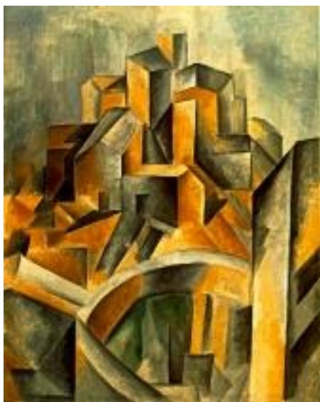
Figura 4- O reservatório – Horta de Ebro Pablo Picasso- 1909- Óleo sobre tela. 60 x 50 cm. Museu de Arte Moderna. Nova York

O exemplo exposto (Figura1) parte da decodificação de um ovo. Particularmente, como cada pessoa perceberia tal forma? Por meio de Picasso e Dalí cria-se tal decodificação do mundo físico sendo retratado poeticamente conforme suas percepções visuais. Assim, temos um cubo, natureza-morta, fazendo referência ao estilo cubista de Picasso (que valorizava as formas cúbicas, geométricas e fragmentadas) e um ovo frito pendurado na árvore, paisagem, fazendo referência aos relógios moles de Dalí (tela A persistência da memória - Figura 5). Agora observemos as pinturas 4 e 5: