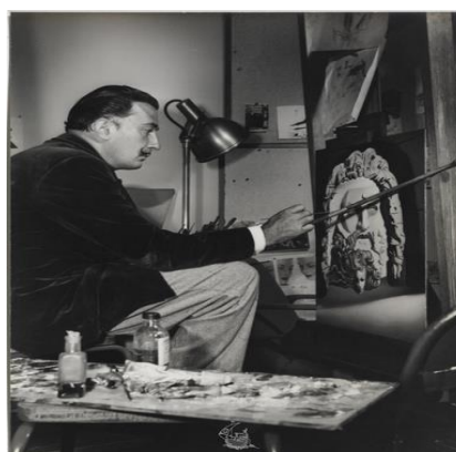
Figura 3- Dalí pintando 2

Também observamos a analogia das roupas da estilização e da fotografia. Assim, com essas fotografias percebemos o conhecimento sobre a produção final da ilustração feita por David Vela.