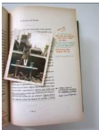
Figura 4: Foto anexa na obra

Como já mencionei, para tornar o objeto livro ainda mais interessante, as páginas são repletas de comentários nas margens, como um mar, ou melhor, uma enseada, com uma grande faixa de areia que rodeia o texto, imensa em seus sentidos; em meio às folhas, há a inclusão de cartas, recortes, fotografias, postais e outros recursos materiais (Figura 4) que constituem a história de S. , fazem parte da conversa entre Eric e Jennifer (Figura 5) e ajudam o leitor a conhecer um pouco mais da misteriosa vida de Straka. De acordo com Brendon Wocke (2014), no artigo intitulado The Analogue Technology of S: Exploring Narrative Form and the Encoded Mystery of the Margins , os autores de S. realizam uma verdadeira “love letter to the written Word” (p.01), 14 por sublinharem de maneira criativa a importância da palavra no papel, do suporte analógico, tátil, que ainda pode potencializar criatividade em um leitor ativo em sua leitura. Saliento a importância de ver o vídeo-chamado, de apenas três minutos, lançado pela Editora. 15