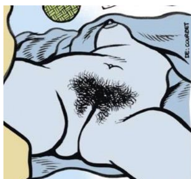
Figura 10 – Releitura de A origem do mundo , Courbet

O sexo feminino, que em Courbet (Cf. Figura 10) é de um profundo realismo, surge como a mais forte metonímia para o corpo feminino que se quer construir: o corpo