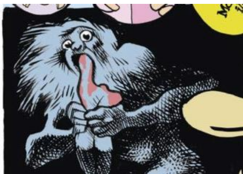
Figura 11 – Releitura de Saturno devorando seu filho , de Goya

A partir da imagem proposta por Goya (Cf. Figura 11), mais que pensar na passagem do tempo, na velhice e na infância, ou mesmo na dimensão política imputada a essa obra, podemos pensar, segundo a temática da dissolução de si que é construída no texto de Laerte, no horror de não se ter autonomia diante do próprio corpo, de vê-lo (literalmente) nas mãos “do Outro”, de um outro que pode dilacerá-lo, desconstruí-lo, refutá-lo. Uma oposição bastante evidente entre a identidade que se busca e a alteridade que a nega.