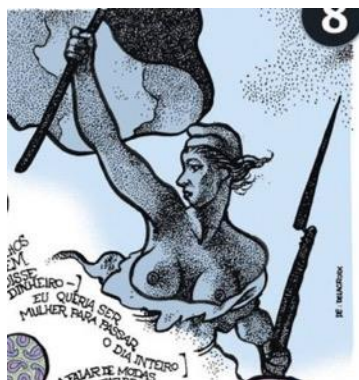
Figura 9- Releitura de A liberdade guiando o povo , de Delacroix

Na obra original do pintor francês, a personagem feminina ocupa lugar central. O procedimento de citação de Laerte (Cf. Figura 9) traz para seu texto também a centralidade da figura feminina que se soma à arma e à bandeira em suas mãos. Feminilizar-se é, nesse sentido, uma revolução, e, portanto, uma posição política